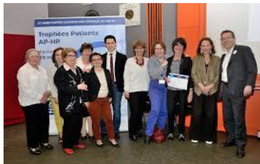
Trophée des patients 2017